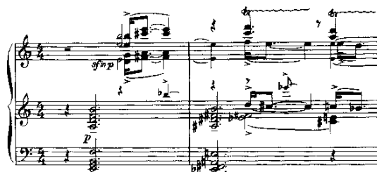
Notenbeispiel 14: III-10, T. 126-127

Mit dieser Regieanweisung leitet Henze das eigentliche Finale ein. Die Erfüllung der prinziplichen Traumvisionen in der Wirklichkeit beginnt im Orchester mit der Restituierung nicht nur der Klangsphäre, sondern auch der Motivik der ersten Szene. Die Akkordik, mit bitonalen Klängen oder erweiterten Dreiklangsstrukturen, stammt aus der Eingangsszene; dazu ist der Satz von den lombardischen Traum-Motiven in den Violinen und Holzbläsern bestimmt, die Violinen verbreiten mit Trillern in der hohen Lage eine schillernde, ätherische Atmosphäre.