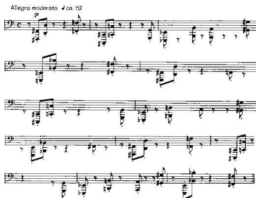
Notenbeispiel 6: I-2, T. 1-12

bar. Die Tonfolge ist zu Anfang und auch später von zwölftöniger Struktur. Die erste Exposition des Szenen-Grundschemas enthält alle zwölf Töne, elf davon je einmal, nur das fis erklingt zweimal — als erster und als letzter Ton der Folge (I-2, T. 1-12). Die in der gesamten Szene (bis zu Homburgs Fortuna-Arie, die den Szenenschluß bildet) stets präsenste Folge wandert durch verschiedene Instrumente, bleibt aber am häufigsten auf Kontrabaß und Cello bezogen, von denen sie auch zuerst gespielt wird.