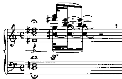
Notenbeispiel 12: II-7, T. 5

Wenn der Vorhang sich öffnet, steht der Kurfürst laut Regieanweisung allein „mit Papieren an einem mit Lichtern besetzten Tisch“ (II-7, T. 1-3). Die Stimmung der dazu erklingenden Akkorde von Blech und tiefen Holzbläsern ist äußerst gedämpft und verhangen. Ein sehr kurzes, wie nebenbei eingeworfenes Motiv des Klaviers könnte ein Hinweis sein, wo der Kurfürst mit seinen Gedanken weilt und was die Ursache für seine melancholische Anwandlung sein mag. Daß diesem Motiv in gegenwärtiger Szene tatsächlich große Bedeutung zukommt, wird indes erst in deren Verlauf offenbar. Es handelt sich um ein völlig aus dem geschlossenen Bläserklang herausfallendes, rasch und kurz aufblitzendes Einsprengsel: