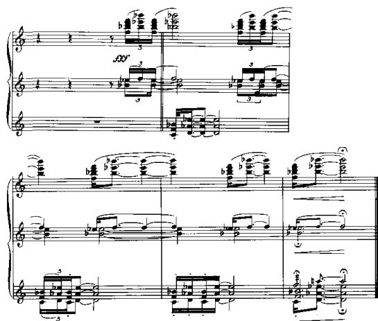
Notenbeispiel 15: III-10, T. 209-213

Es ist in diesem differenzierten Ensemble indes vor allem die Musik, die eine solche Lesart beglaubigt. Die Begleitung des Orchesters verbleibt auch am Schluß der Szene ganz in Homburgs Bereich. Der Hauptteil des Orchesters begleitet den Gesang mit typischen ‘Homburg-Akkorden’ und mit dessen Klangfarben, denn in diesen Liegeklängen übernehmen abwechselnd die Streicher und die Holzbläser die Führung, während die Blechbläser von Takt 186 bis 204 überhaupt nicht beteiligt sind. Erst mit dem Übergang zum Schlußabschnitt des Ensembles setzt in Takt 205 ein gemeinsames Motiv der Trompeten und Posaunen ein, das als Variante des lombardischen Traum-Motives erkennbar ist und vom gesamten Orchester ab Takt 209 übernommen wird.