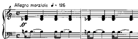
Notenbeispiel 7: I-3, A, T. 143-144

Henze beglaubigt die bisher ungeahnte Entschlußkraft und Energie Homburgs mit einem Allegro marziale des Orchesters im Moment des Angriffsbefehls.