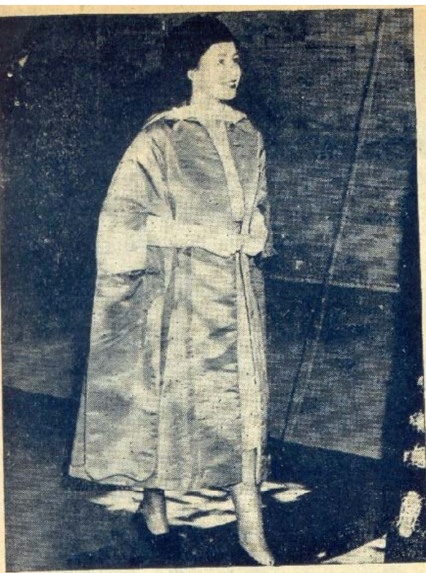
Prinzessin Elisabeth hat von der Londoner Universität das „Baccalaureat für Musik“ verliehen bekommen. Unser Bild zeigt sie nach der feierlichen Verleihung des „BACCALAU-REAT“ in der Robe, die ihre neue Würde kennzeichnet.