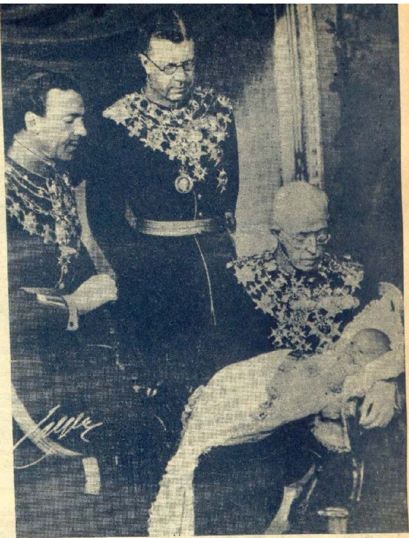
Der jüngste Großvater König Gustavs von Schweden wird getauft. — Die Aufnahme zeigt den Urgroßvater, den Kronprinzen Gustav Adolf (Mitte) und den Vater, Prinzen Gustav Adolf, mit dem jüngsten Mitglied der Familie Bernadotte, dem Prinzen Carl Gustav, während der Taufe in Stockholm. (Aufn.: British I. S. B.)